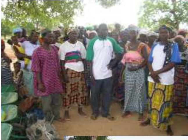
Comissió encarregada de l'hort