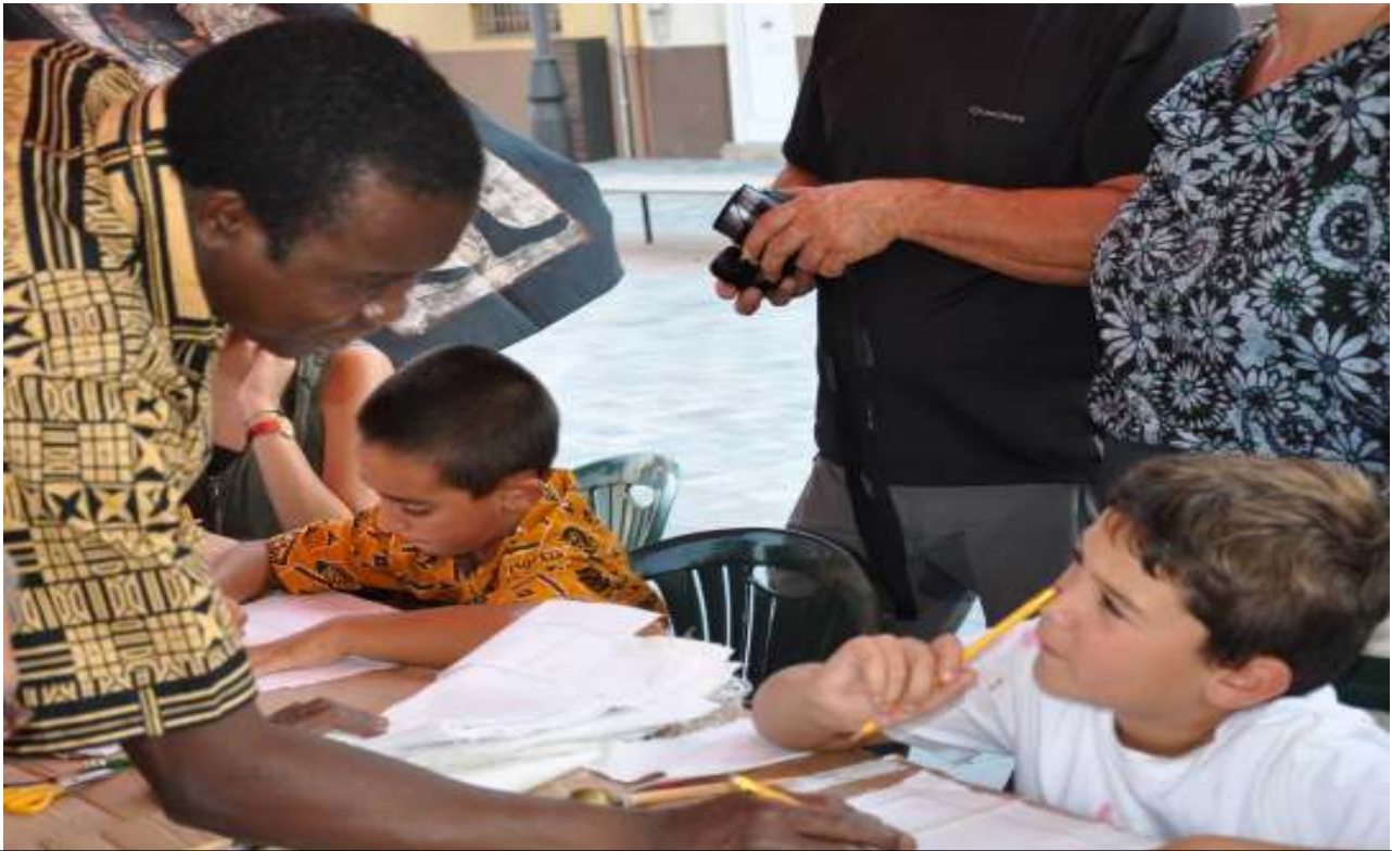
Africa Viva – Memòria 2010